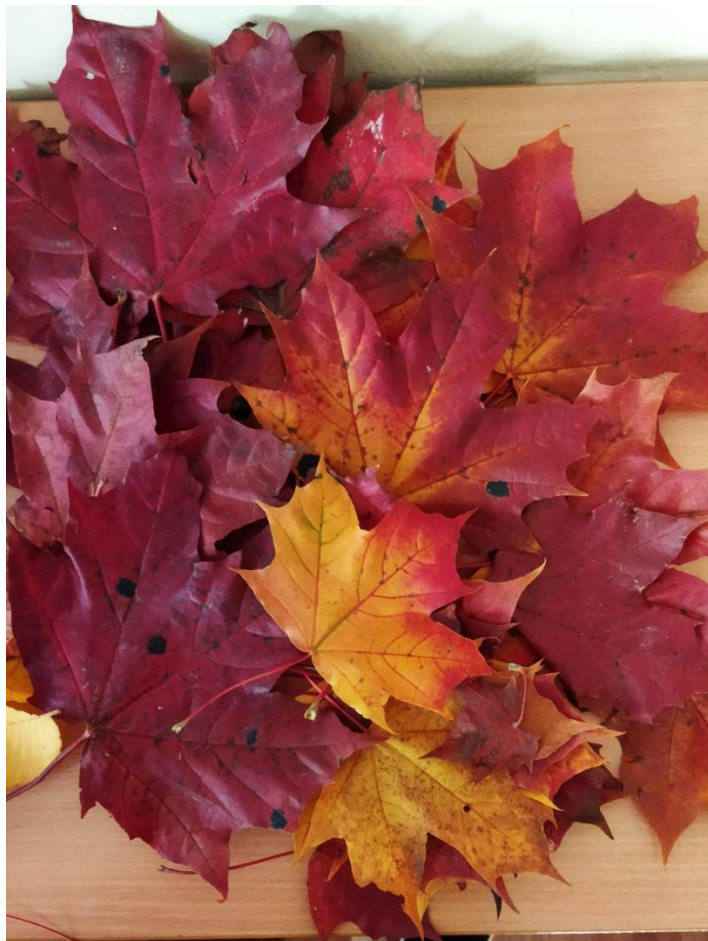
Сбор листьев для гербария