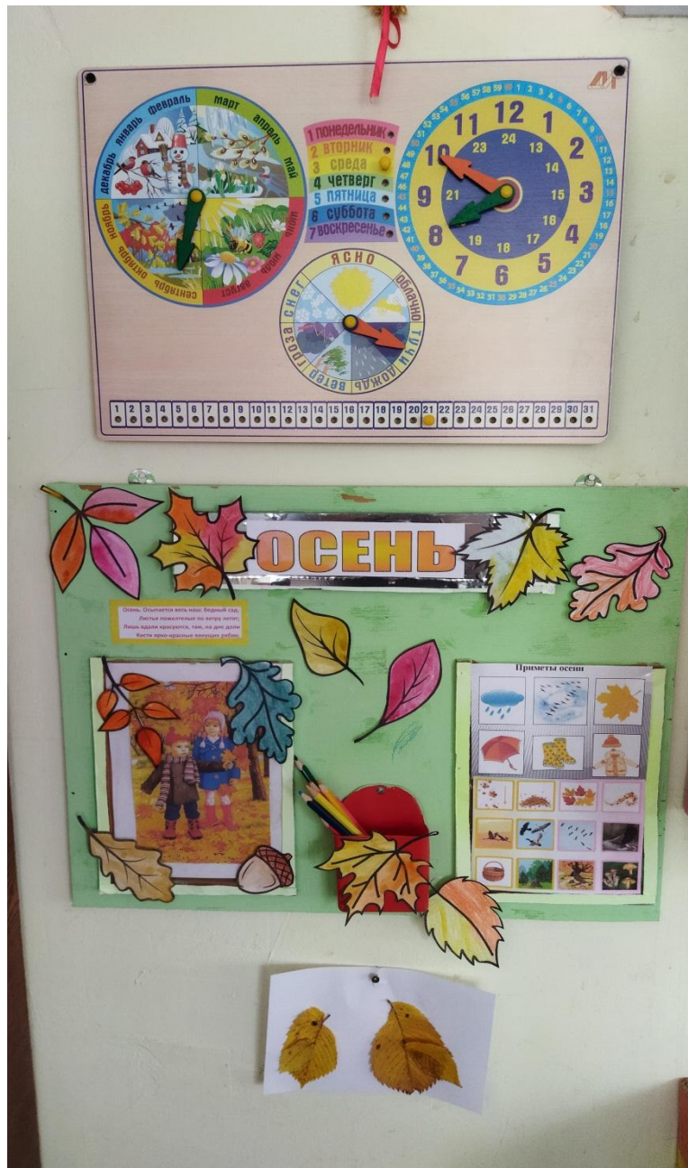
Оформление уголка природы вместе с детьми