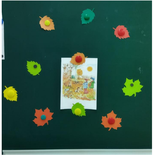
Оформление интерьера группы