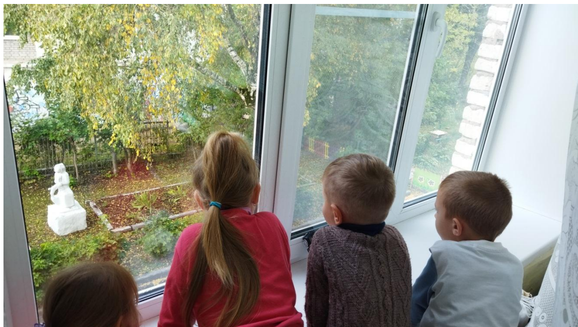
Наблюдение за погодой, осенними изменениями в природе