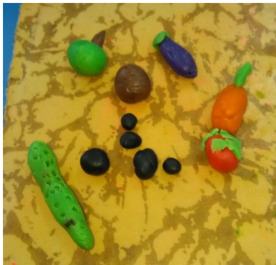
Самостоятельная художественная деятельность: лепка «Дары осени»