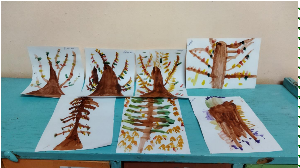
Рисование на тему: «Золотая осень»