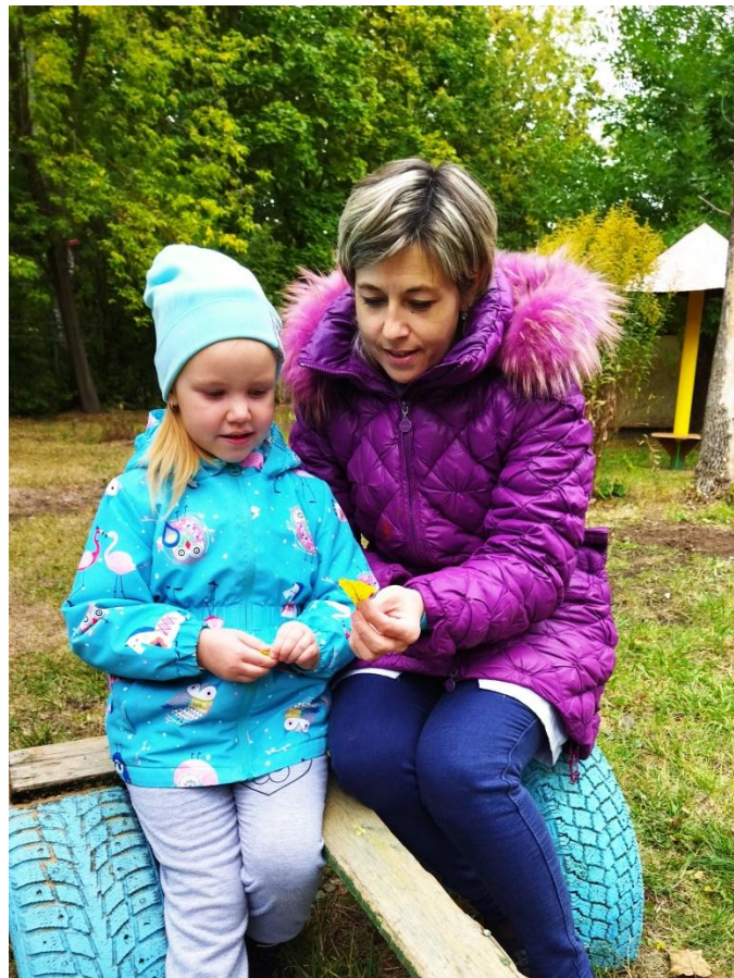
Наблюдение за осенними листьями