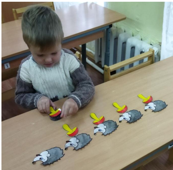
Считаем ёжиков и грибочки, закрепляем порядковый счёт до 5