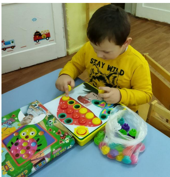
Игровая деятельность детей