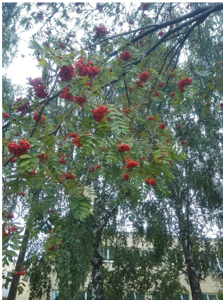
Рассматриваем веточки рябины