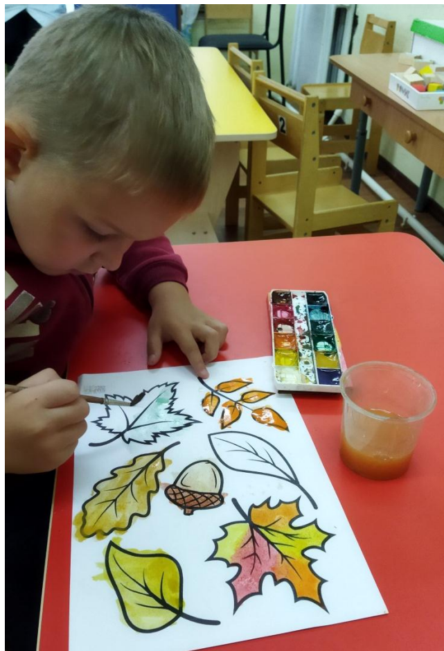
Раскраски на тему: «Осень», раскрашиваем осенние листья в уголок природы