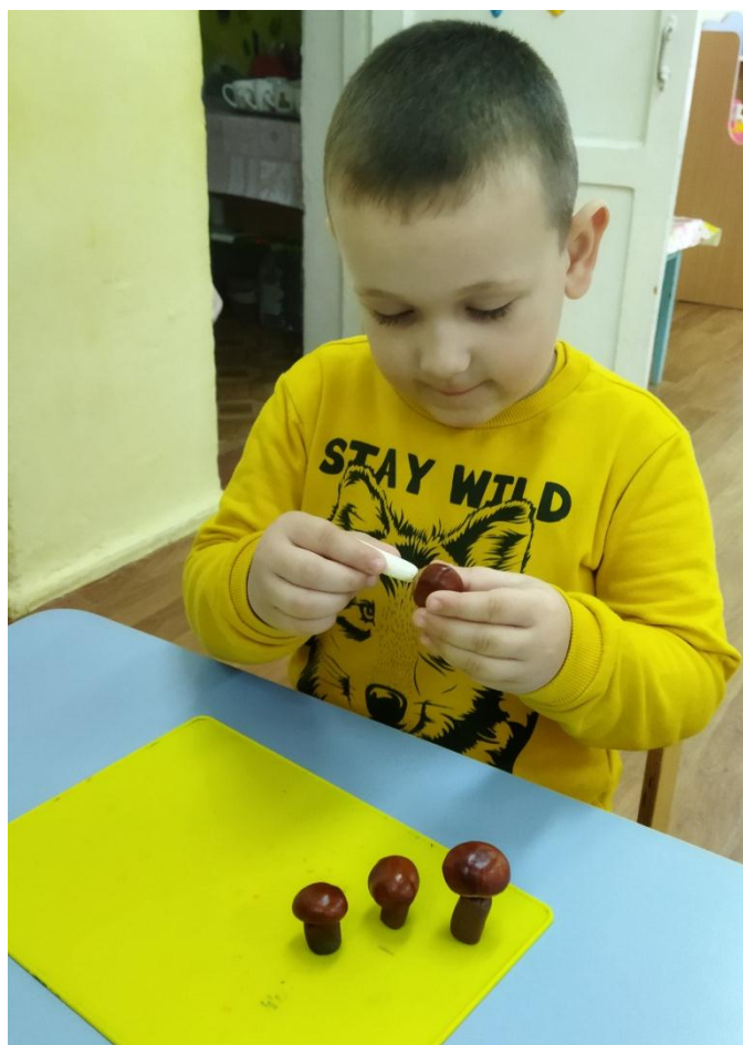
Лепка «Грибы» (с использованием каштана)