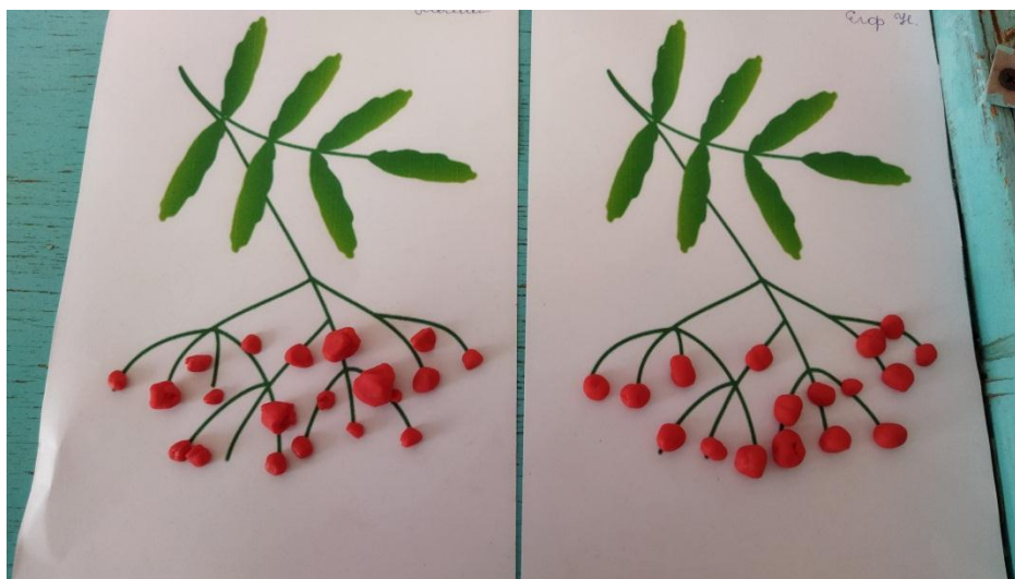
Лепка «Ветка рябины» (пластилинография)