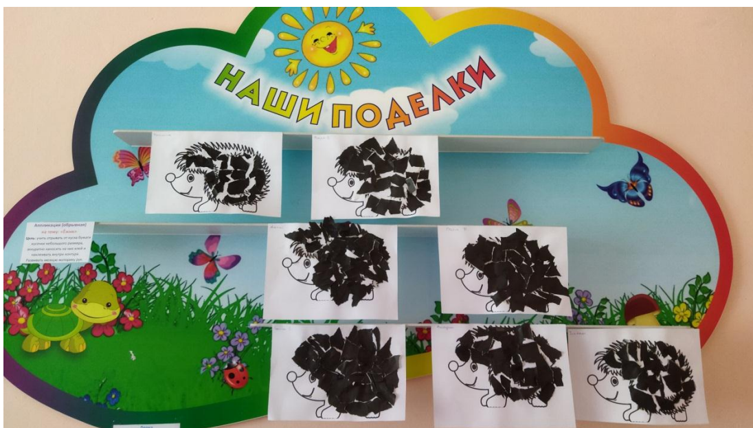
Аппликация «Ёжик» (обрывная)