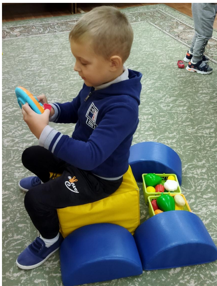
Сюжетно-ролевая игра «Овощной магазин»