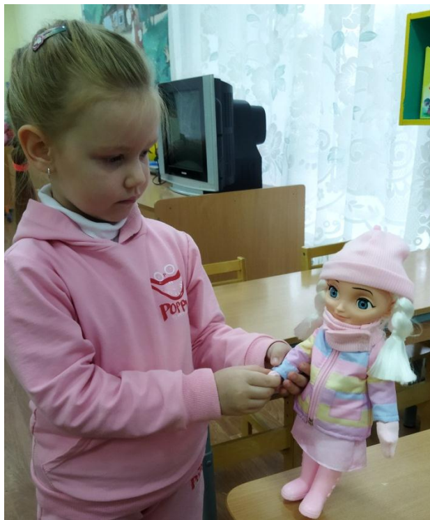
Беседа: «Одежда осенью»