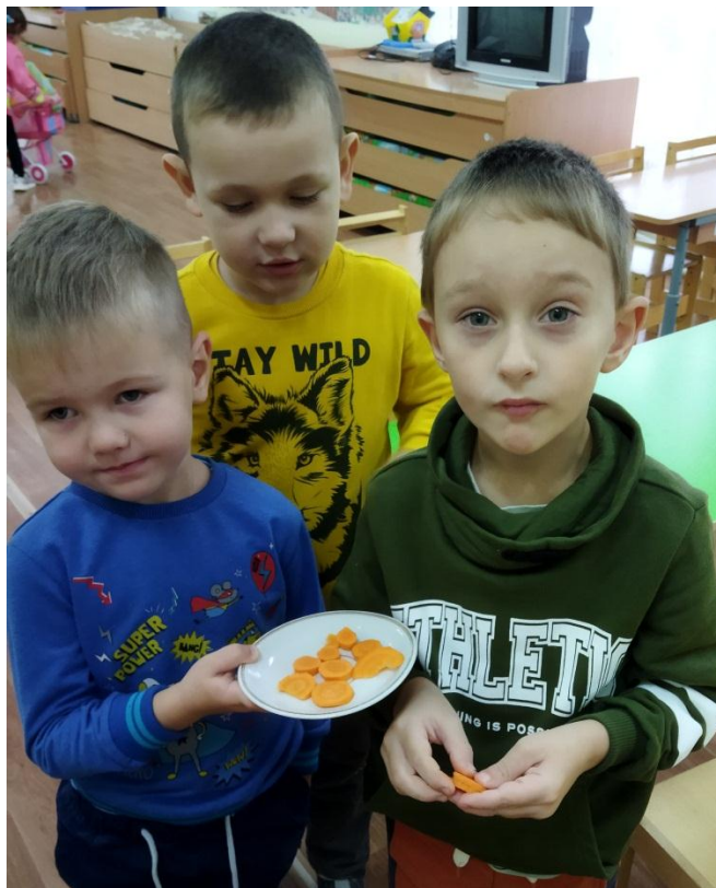
Угощаемся дарами осени» (морковь)