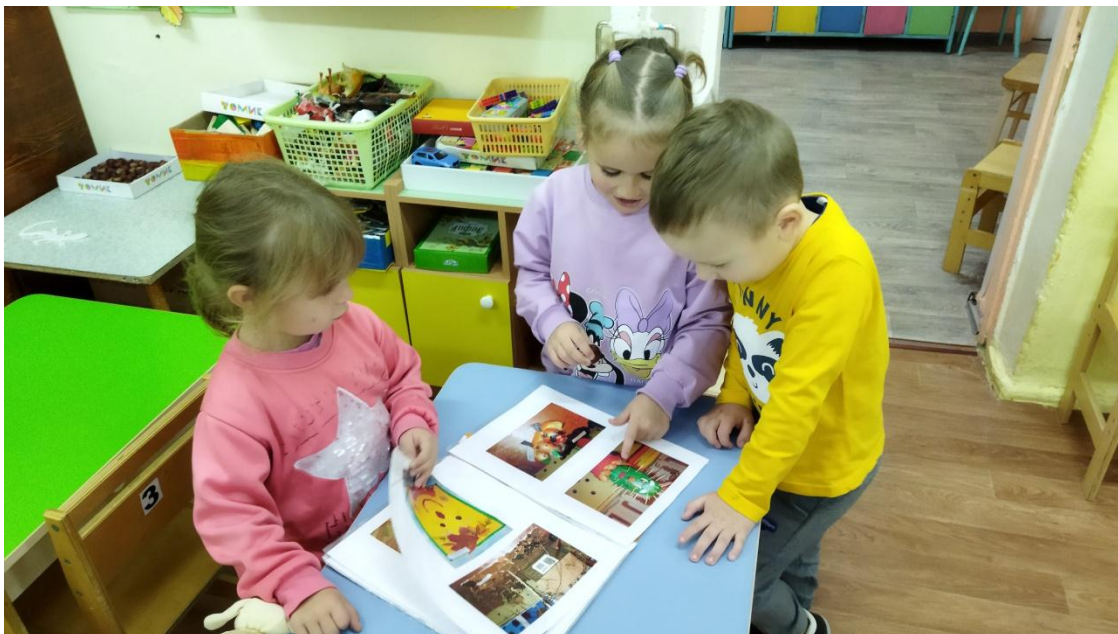
Рассматривание альбомов на тему: «Времена года», «Осень», «Подделки из природного материала»