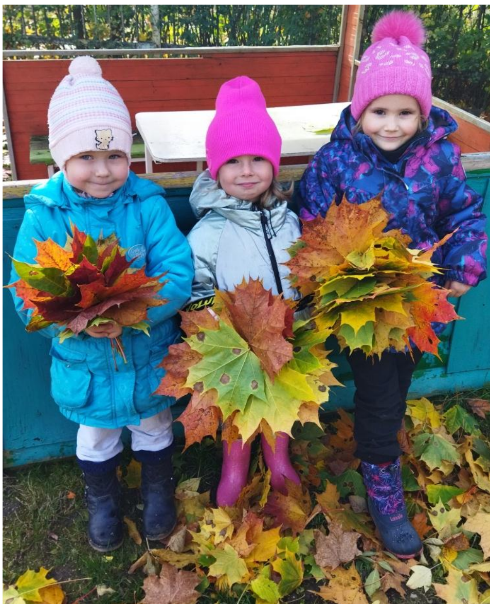
Собираем осенние букеты из разноцветных листьев