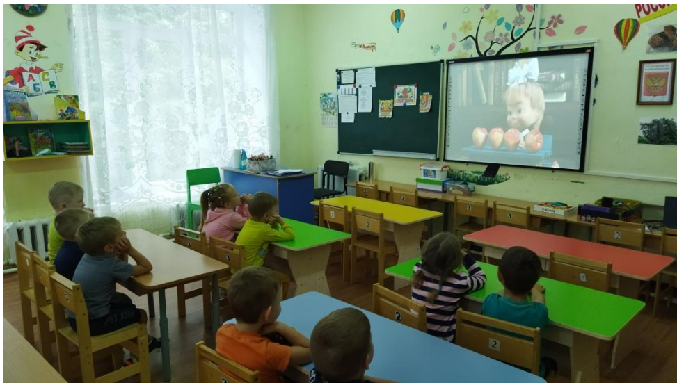
Просмотр мультфильма «В первый раз в первый класс» (к 1 сентября) и беседа о том, что 1 сентября наступила осень.